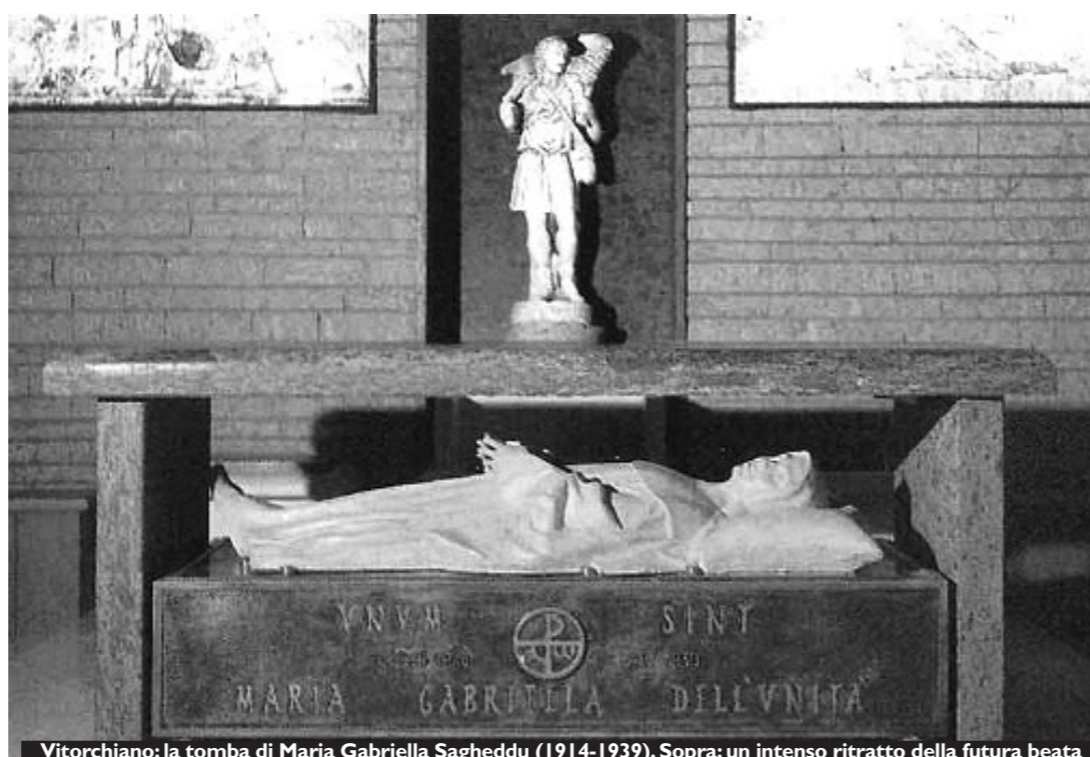
Vitorchiano: la tomba di Maria Gabriella Sagheddu (1914-1939). Sopra: un intenso ritratto della futura beata

beatificazione di Maria Gabriella risveglia in noi il desiderio di donare la nostra vita ogni giorno al Signore, per edificare in Cristo l'armonia dell'unità fra i cristiani, che è fonte di unità fra tutti gli uomini. Il mondo ha sete di pace ed anche le comunità del nostro territorio, provate da risorgenti ombre di violenza e di morte, hanno un grande bisogno di serenità e di pace. L'unità d'amore tra le famiglie cristiane può far giungere a tutti il dono divino della pace. Giovani e adulti nella fede! Guardiamo con gratitudine alla testimonianza della beata Maria Gabriella, meditiamo sulla storia della sua vita, ascoltiamo con affetto la sua voce: «Ho fatto con Gesù un patto nuziale di eterno amore. Egli sarà tutto mio e io sarò tutta sua... È veramente grande l'amore di Gesù... E tanto bello vivere nella casa del Signore... Amiamo il nostro Dio Signore, amiamo la nostra Chiesa!». Oggi, come venticinque anni fa, dobbiamo far tesoro delle parole pronunziate dal Papa Giovanni Paolo II nel giorno della sua